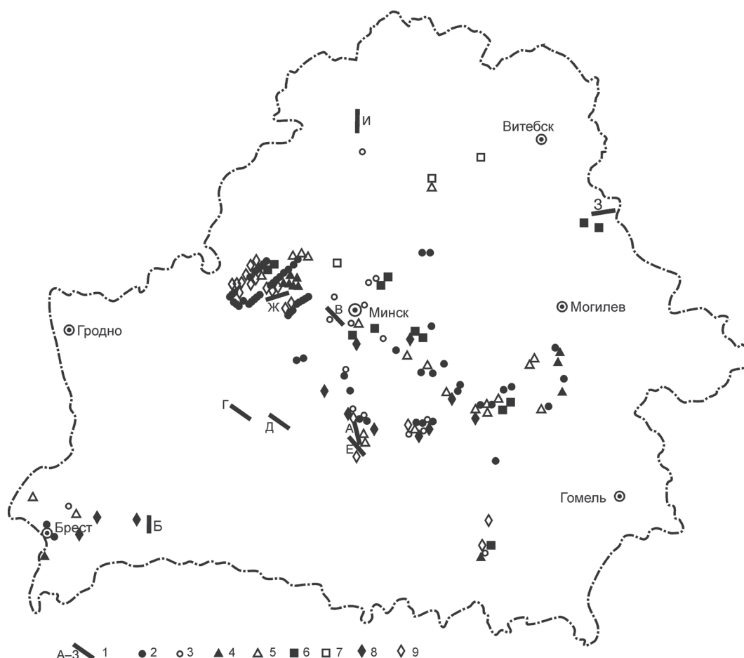
Рис. 1. Схема отбора проб покровных отложений: 1 – ключевые участки (А – Слуцкий, Б – Антопольский, В – Минский, Г – Подлесский, Д – Грицевичский, Е – Солигорский, Ж – Воложинский, З – Дубровенский, И – Шарковщинский); места отбора отдельных проб покровных отложений: 2 – флювиогляциальных, 3 – краевых ледниковых, 4 – моренных, 5 – аллювиальных, 6 – лессовидных, 7 – озерно-ледниковых, 8 – торфа, 9 – озерно-аллювиальных

Материалы и методы исследований. Покровные (почвообразующие) отложения на территории Беларуси относятся преимущественно к ледниковой формации, в составе которой преобладают моренные, флювиогляциальные, краевые ледниковые и озерно-ледниковые комплексы,